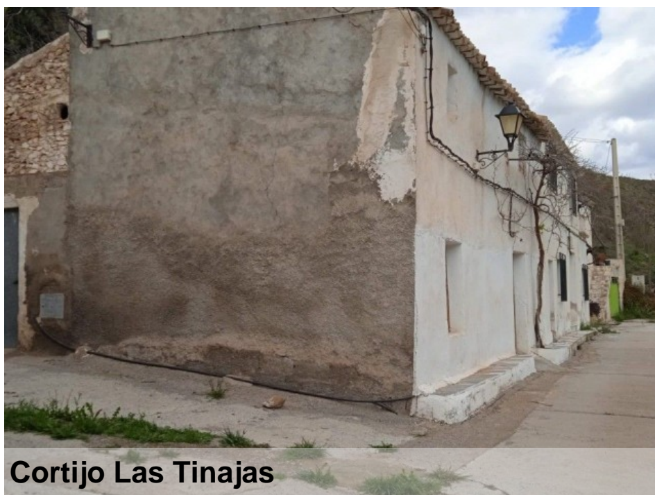
Cortijo Las Tinajas